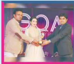
Global Quality Awards

Award for Quality Coaching Services GATE / IES / Civil Exams