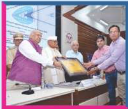
MP Education Summit & Award

Engineering Entrance Coaching GATE and SSC-JE