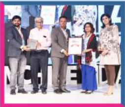
Indian Education Award

Excellent Coaching for GATE & SSC-JEn in North India