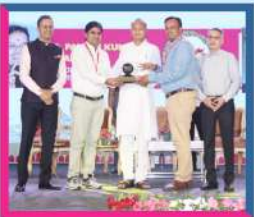
Pride of Rajasthan

Best Coaching for GATE & PSUs Award By C.M. ASHOK GEHLOT JJ