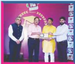
Education Excellence Award

Best Coaching for GATE & PSUs Award By C.M. ASHOK GEHLOT JJ