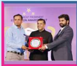
India's Most Prominent Education Awards

Excellence in results of ESE, GATE, PSUs and SSC-JE